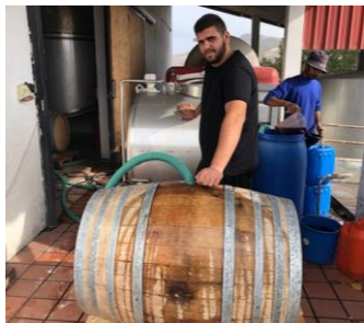
ΓΕΜΙΣΜΑ ΒΑΡΕΛΙΟΥ ΠΑΛΑΙΩΣΗ ΚΡΑΣΙΟΥ ΓΙΑ 6 ΜΗΝΕΣ