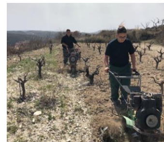
ΚΑΛΛΙΕΡΓΕΙΑ ΕΠΙΠΟΝΗ ΕΡΓΑΣΙΑ ΜΕ ΚΡΥΟ ΚΑΙ ΑΓΙΑΖΙ