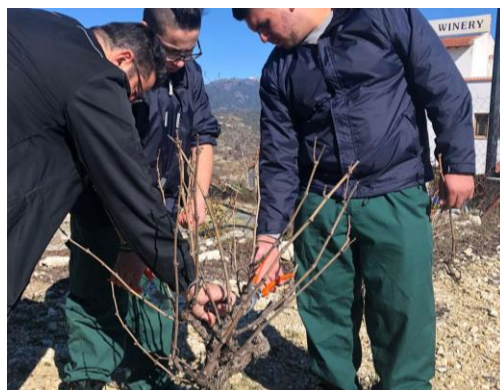
ΚΛΑΔΕΜΑ ΚΥΠΕΛΟ Η ΚΟΡΔΟΝΙ ΓΙΑ ΚΑΛΥΤΕΡΗ ΚΑΡΠΟΦΟΡΙΑ