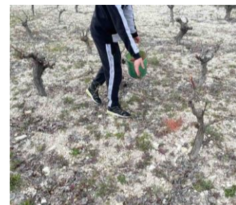
ΛΙΠΑΣΜΑ ΟΣΟ ΠΙΟ ΚΟΝΤΑ ΣΤΟΝ ΚΟΡΜΟ ΓΙΑ ΚΑΛΥΤΕΡΗ ΑΠΟΡΡΟΦΗΣΗ ΤΩΝ ΣΥΣΤΑΤΙΚΩΝ