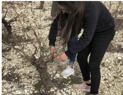
ΚΛΑΔΕΜΑ ΔΙΑΦΟΡΕΤΙΚΑ ΣΧΗΜΑΤΑ ΑΝΑΛΟΓΩΣ ΑΜΠΕΛΩΝΑ