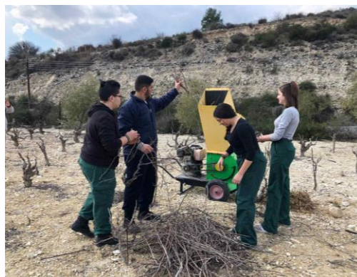
ΑΝΑΚΥΚΛΩΣΗ ΣΤΟΝ ΙΔΙΟ ΧΩΡΟ ΤΑ ΚΛΗΜΑΤΑ ΑΛΕΘΟΝΤΑΙ ΚΑΙ ΑΠΛΩΝΟΝΤΑΙ ΣΤΟ ΑΜΠΕΛΙ ΓΙΑ ΕΜΠΛΟΥΤΙΣΜΟ ΤΟΥ ΕΔΑΦΟΥΣ