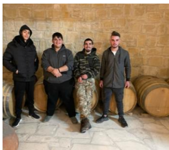
ΒΑΡΕΛΙΑ ΠΑΛΑΙΩΣΗΣ ΔΙΑΦΟΡΑ ΕΙΔΗ ΚΡΑΣΙΟΥ ΓΙΑ ΒΕΛΤΙΩΣΗ ΤΩΝ ΧΑΡΑΚΤΗΡΙΣΤΙΚΩΝ