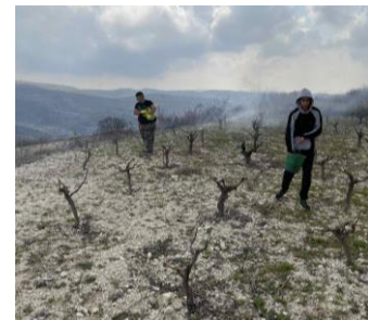
ΛΙΠΑΣΜΑ ΠΡΙΝ ΤΗΝ ΚΑΛΛΙΕΡΓΕΙΑ ΕΜΠΛΟΥΤΙΖΕΤΑΙ ΤΟ ΕΔΑΦΟΣ